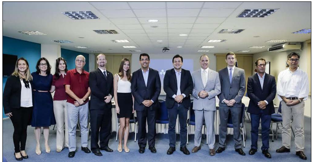
O projeto é o primeiro no Brasil capitaneado por uma gestão pública e foi apresentado a representantes do Japão, Alemanha, Argentina, Estados Unidos e Grã Bretanha

O momento também foi importante para que a comunidade internacional conhecesse como funciona essa parceria do setor público com o terceiro setor, e que tem disseminado essa ideia para além do Recife, com o objetivo de servir de exemplo para seus países. Além disso, a reunião - que contou com representantes do Japão, Alemanha, Argentina, Estados Unidos e Grã Bretanha -