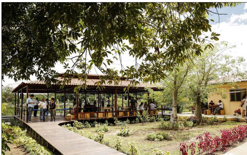
Novas estruturas foram entregues no parque que também terá sua área total ampliada a partir de uma incorporação de terreno cedido pela Fundação CDL

Outra novidade do espaço foi a instalação de painéis para captação de energia solar, custeado pelo programa internacional Urban LEDS, através de uma parceria entre a prefeitura e o Iclei. A expectativa é de que eles gerem cerca de 2.250 kilowatts/mês, o equivalente a 30% de todo o consumo do Jardim Botânico ou a cinco residências. Calcula-se que as chamadas placas fotovoltaicas proporcionem uma economia mensal de R$ 1.500,00 na conta de luz, além de terem um tempo de vida útil de 25 anos.